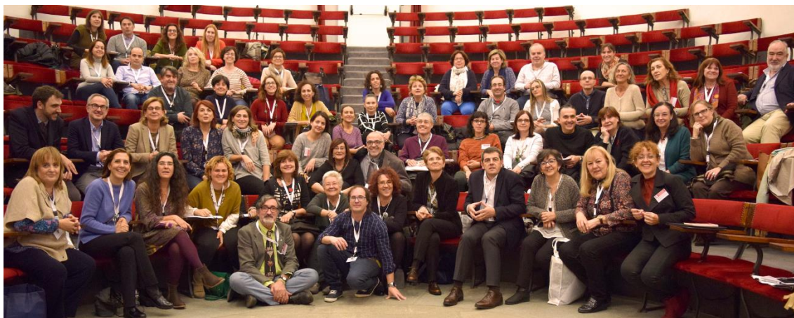
Figura 3. I Jornada BiblioMadSalud