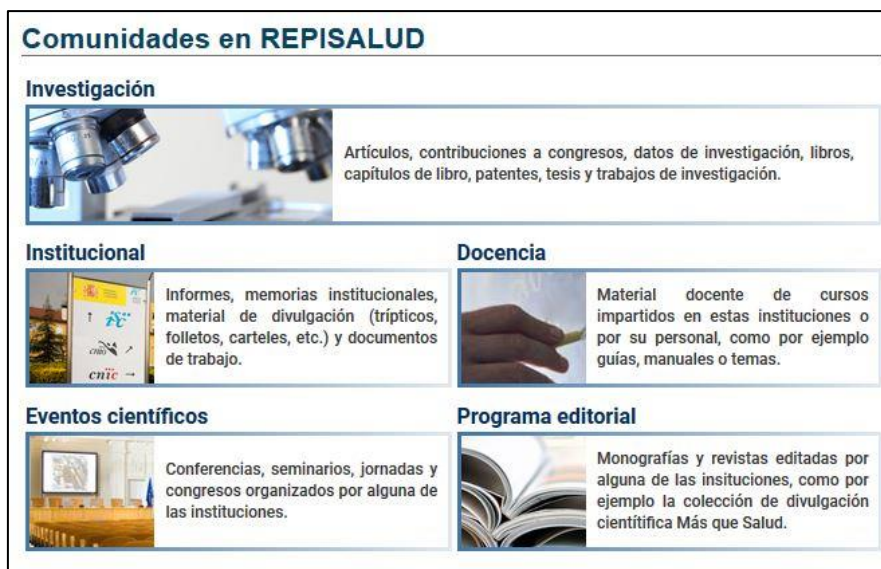
Figura 1. Comunidades en Repisalud

De esta manera se destaca la producción científica frente a estructuras organizativas y nos permite integrar en un futuro nuevas instituciones.